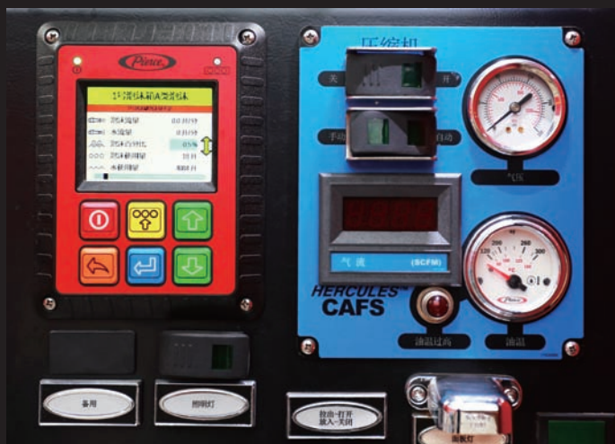
中文泡沫控制系统