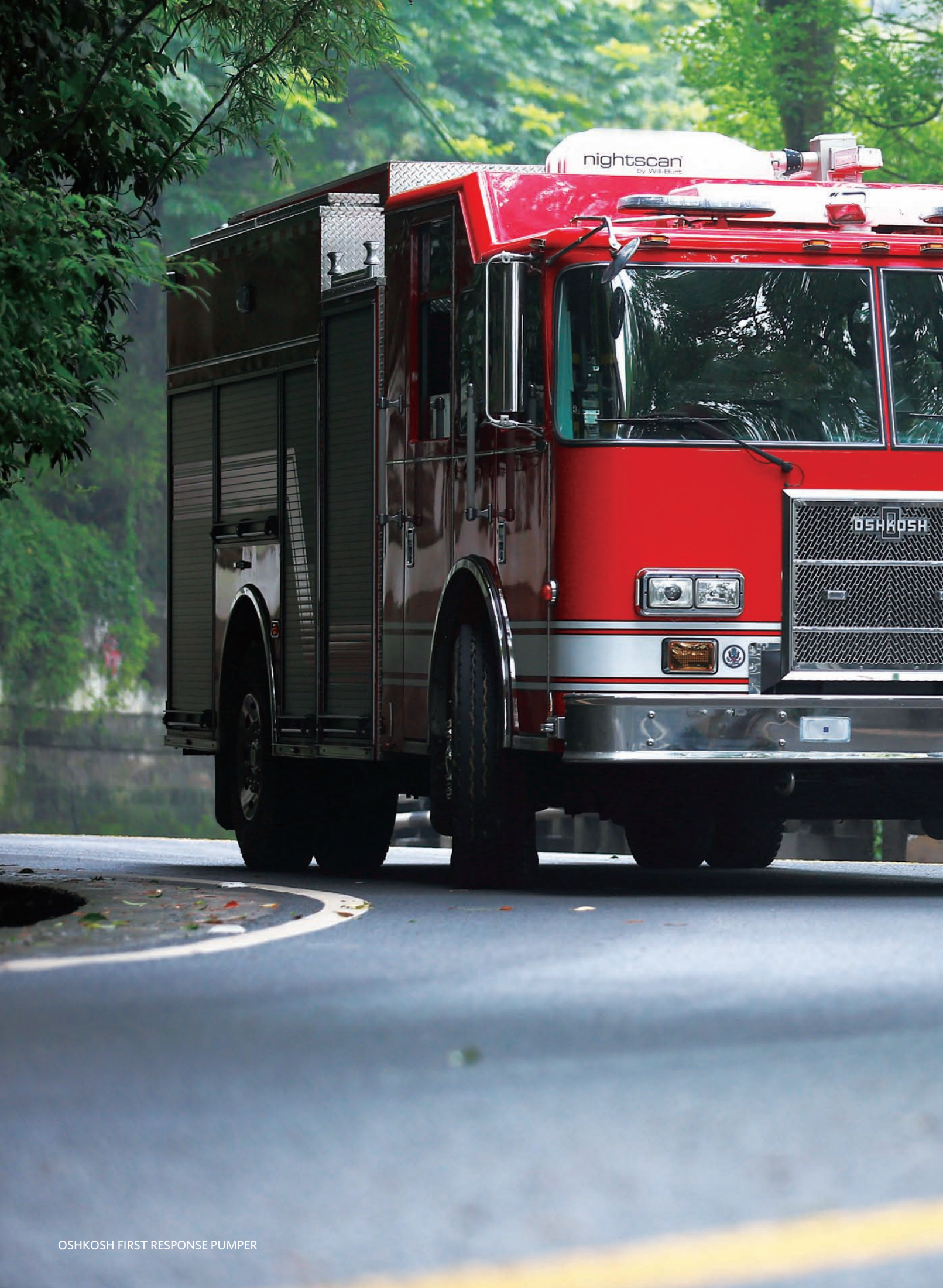
OSHKOSH FIRST RESPONSE PUMPER