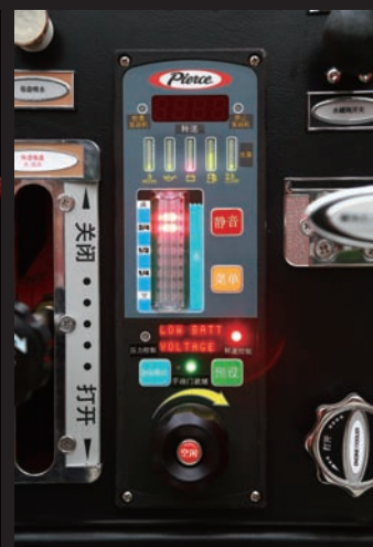
自动压力控制中心